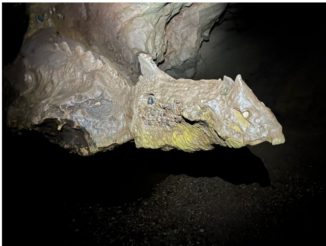
Drac de les Coves de Sant Josep, foto de Mabel Almendros

8. Marrako, el senyor de la muntanya, mig drac, mig os, és en realitat un monstre draconià d'origen ibèric sobre el qual s'han mantingut les creences en les terres de Lleida durant més de 2000 anys. Curiosament, en èuscar, marrako és una altra manera de dir "drac". Se t'ocorren altres monstres o espantacriatures que puguen tindre arrels tan antigues com estes o estar-ne relacionats?